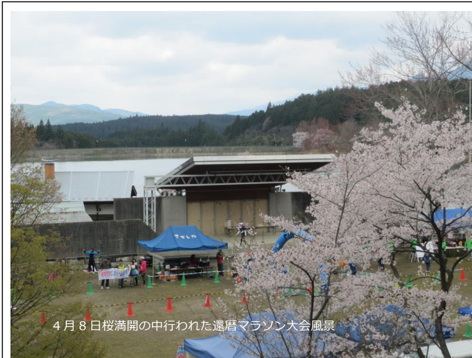
4月8日桜満開の中行われた遠暦マラソン大会風景

全日本大会(ロング種目)が、(公社)日本オリエンテーリング協会の直轄大会になって2年目。このスポーツ組織の最大にして最高の大会となるべく改革を進めております。今回の舞台は過去にも多くの全国大会や国際大会が開催された岐阜県中津川市の“椈の湖”、「日本のフォークソング発祥の地」とも呼ばれている所です。木曾川が深く切り刻んだ溪谷からお椀型の山を登っていくと、良好で適度な傾斜の森林が現れ、まさにそこはオリエンテーリングの別天地。わが国のトレインの中で最も中央ヨーロッパに近い本格的トレインの様相です。この地でナビゲーションスポーツとしての王道「オリエンテーリング」の”森の王者”を決します。真に生涯スポーツ、全年齢層が一同に会する最も晴れやかな舞台を用意します。