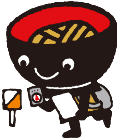
第 71 回国民体育大会(希望郷いわて国体)マスコット 「そばっち」