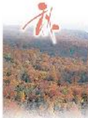
山々がキトンバスに広がる秋 (八幡平 道の駅八幡平)

夏は朝風が心地よく、山桜やアザミが咲き、初夏にはツツジやアサギアザミが咲き、秋は紅葉が美しい。冬は雪に包まれ、温泉が湧き出す。八幡平は、四季折々の美しい風景と、豊富な温泉に恵まれた観光地です。