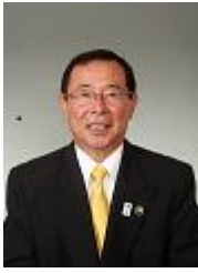
八幡平市長 田村 正彦

「第 25 回全日本リレーオリエンテーリング大会」が岩手県八幡平市安比高原で盛大に開催されますことは、誠に光栄であり全国各地からお越しの選手並びに関係者の皆様を市民とともに心から歓迎申し上げます。