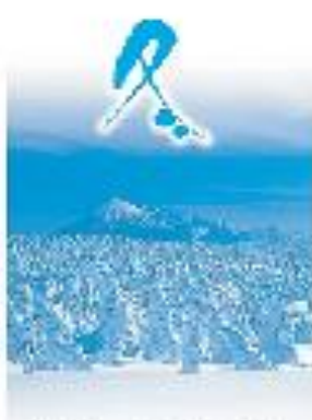
ウインターリゾート地帯の冬 (八幡平 道の駅)

紅葉が美しい八幡平の秋は、山桜やアザミが咲き、初夏にはツツジやアサギアザミが咲き、秋は紅葉が美しい。冬は雪に包まれ、温泉が湧き出す。八幡平は、四季折々の美しい風景と、豊富な温泉に恵まれた観光地です。