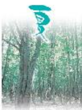
爽やかな朝風が心地よい夏 (道の駅 道の駅八幡平)

八幡平は、春は山桜やアザミが咲き、初夏にはツツジやアサギアザミが咲き、秋は紅葉が美しい。冬は雪に包まれ、温泉が湧き出す。八幡平は、四季折々の美しい風景と、豊富な温泉に恵まれた観光地です。