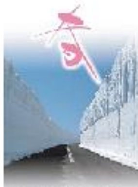
雪に包まれた八幡平の春 (アスレチックパーク 道の駅八幡平)

八幡平市は岩手山・八幡平・安比高原・七時南山が連なる壮大な自然に恵まれ、豊富な温泉、晨り豊かな大地、四季折々の美しい風景はまさに自然からの贈り物と言えるでしょう