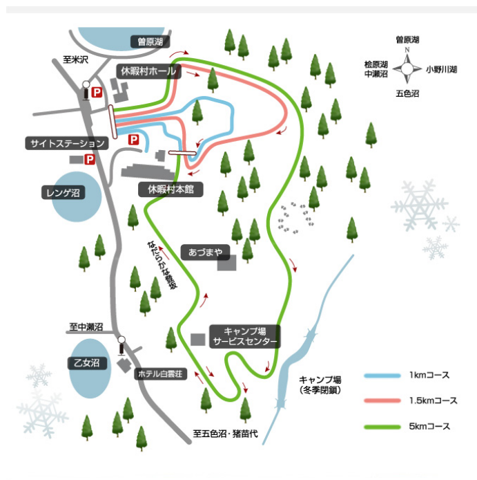
休暇村 裏磐梯 Web サイトより