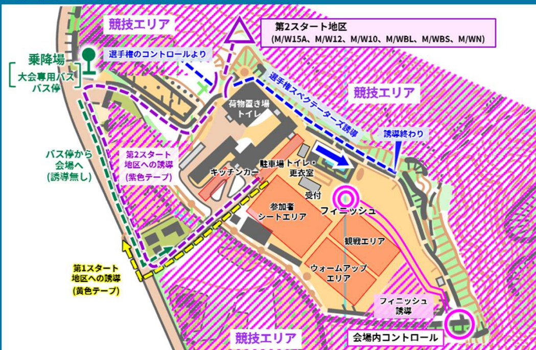
11/4(土) ミドル会場レイアウト