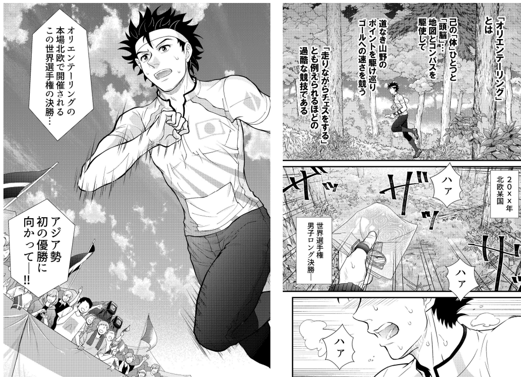
漫画の一コマより (著者の承諾を得て掲載)

https://rookie.shonenjump.com/series/X1vJnKZOAw8