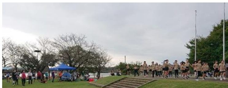
表彰式を盛り上げたキッズダンス